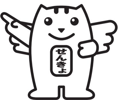
明るい選挙イメージキャラクター めいすいくん