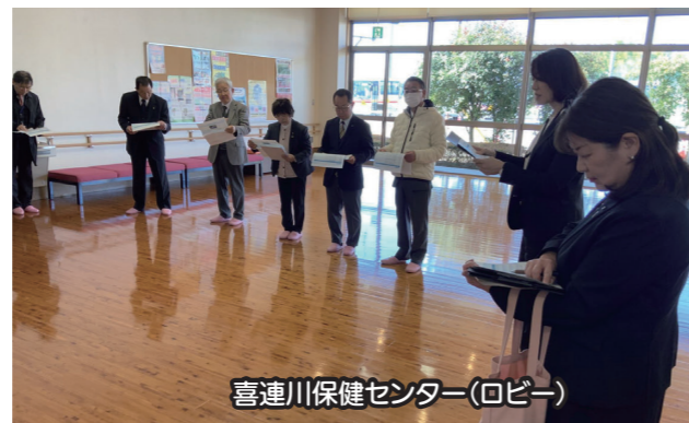
喜連川保健センター(ロビー)