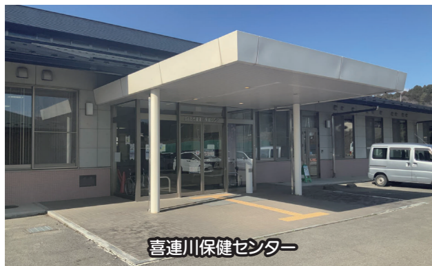
喜連川保健センター