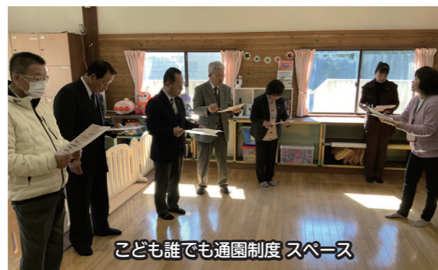
こども誰でも通園制度 スペース